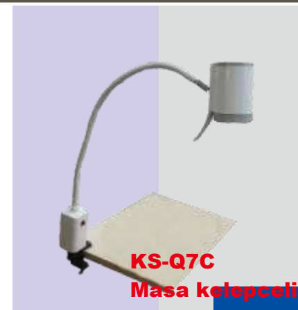
KS-Q7C Masa kelepçeli