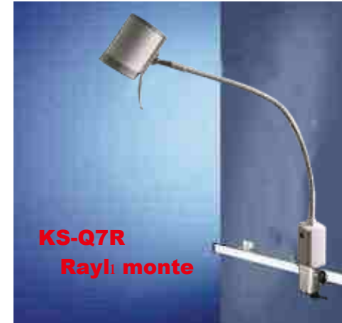
KS-Q7R Raylı monte