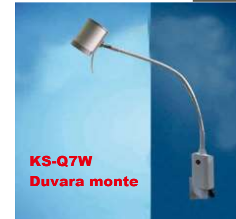
KS-Q7W Duvara monte